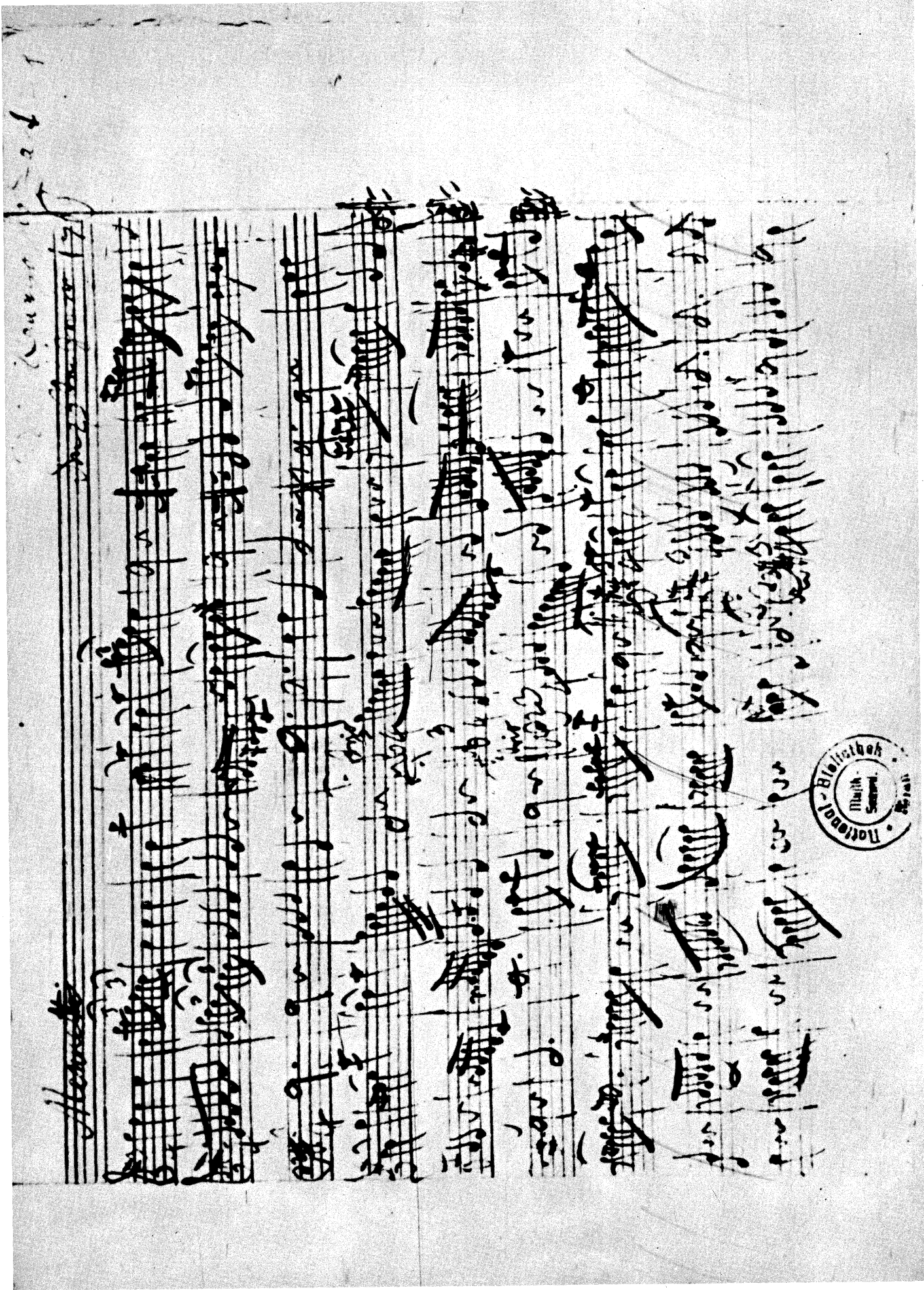
Sieben Menuette KV 65 a (61 b ): Erste Seite nach dem im Besitz der National-Bibliothek, Wien, befindlichen Autograph (vgl. Seite 1: Menuett und Trio No. 1, und Seite 2: Menuett No. 2, Takt 1-6).