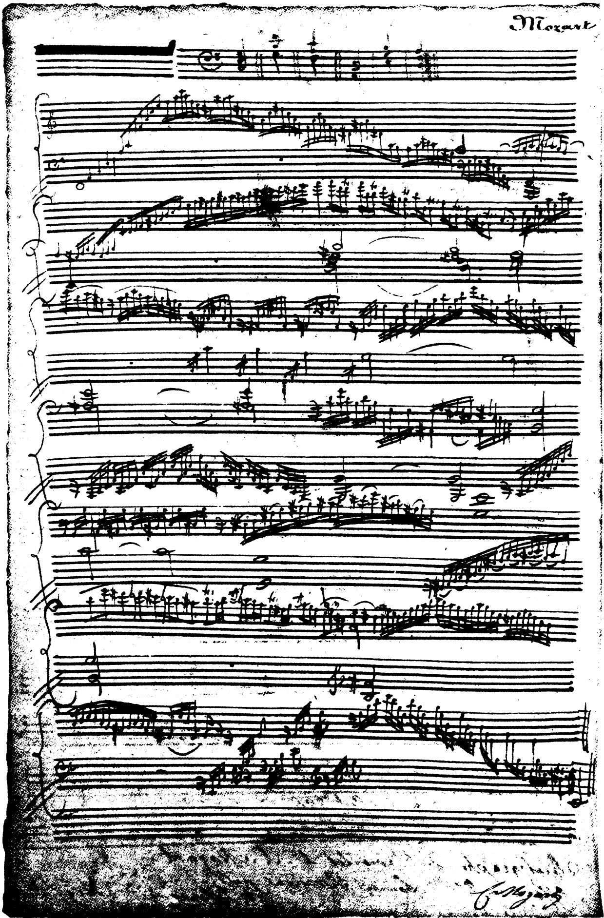
Modulierendes Präludium (F-e) KV deest = I, Nr. 2: Autograph (Nationalbibliothek Széchényi Budapest). Vgl. Seite 4-5.