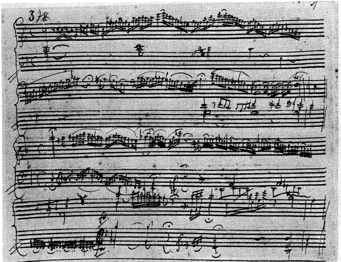
Konzert in C KV 246: Autograph der Kadenzen B zum ersten und zweiten Satz (British Library London, Sammlung Cecil B. Oldman). Vgl. Seite 26, 41 und Vorwort.