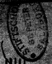
Konzert in Es KV 271: erste Seite der Klavierstimme aus dem Salzburger Stimmenmaterial (Musikaliensammlung der Erzabtei St. Peter Salzburg, Signatur: Moz 240.1) mit Eintragungen (u. a. Generalmaßbezeichnung) von der Hand Leopold Mozarts. Vgl. Seite 65–68, Takt 1–33 und Vorwort.