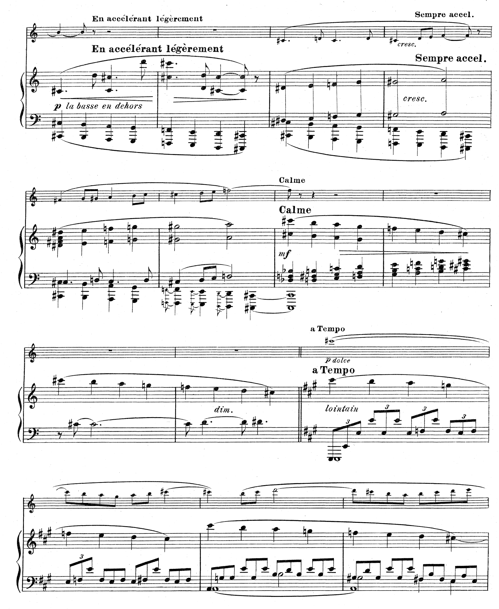
D.& F. 10,851