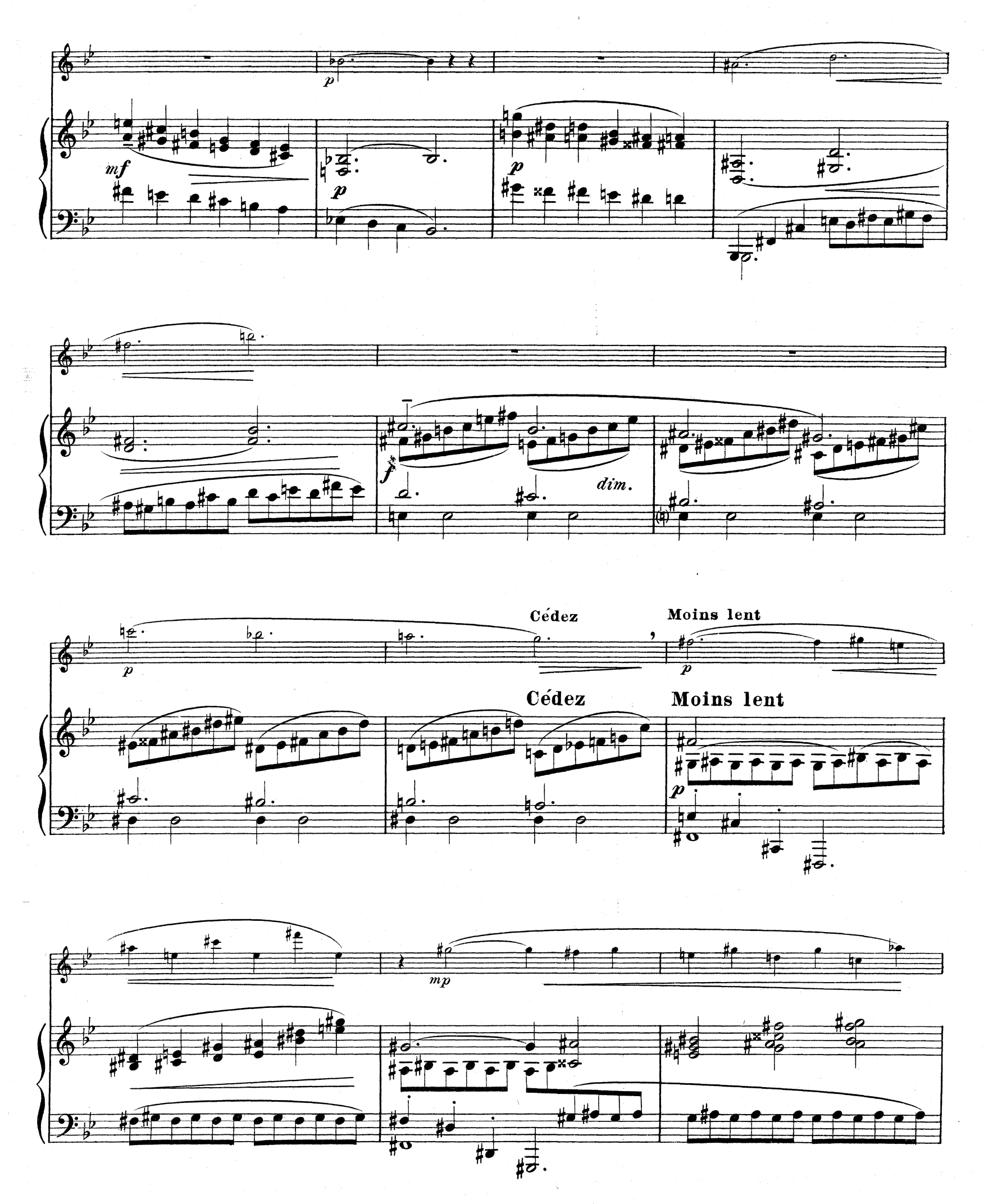
D.& F. 10,851