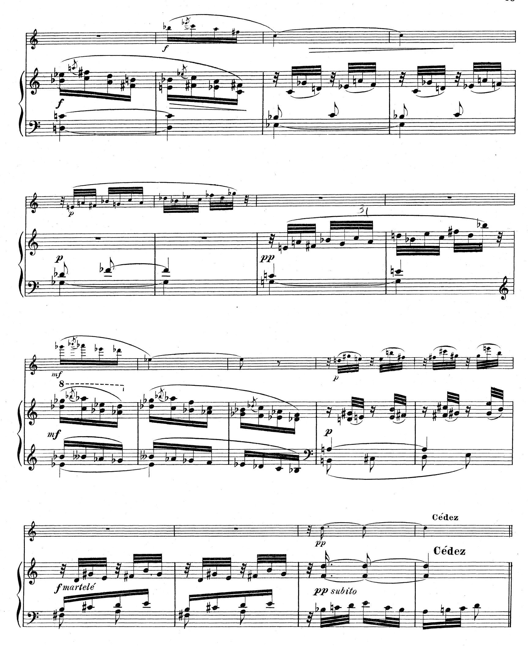
D.& F. 10,851