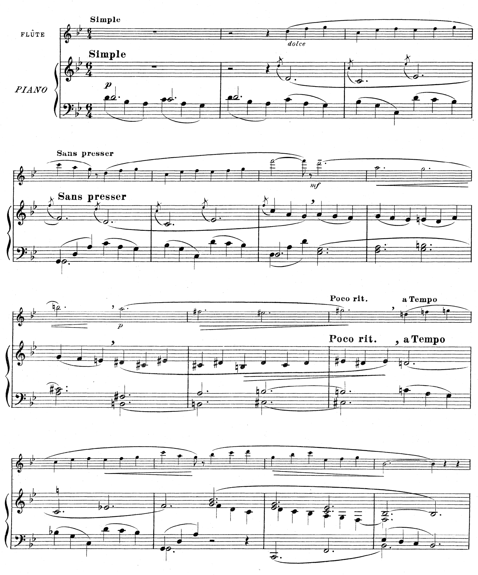
D.& F. 10,851