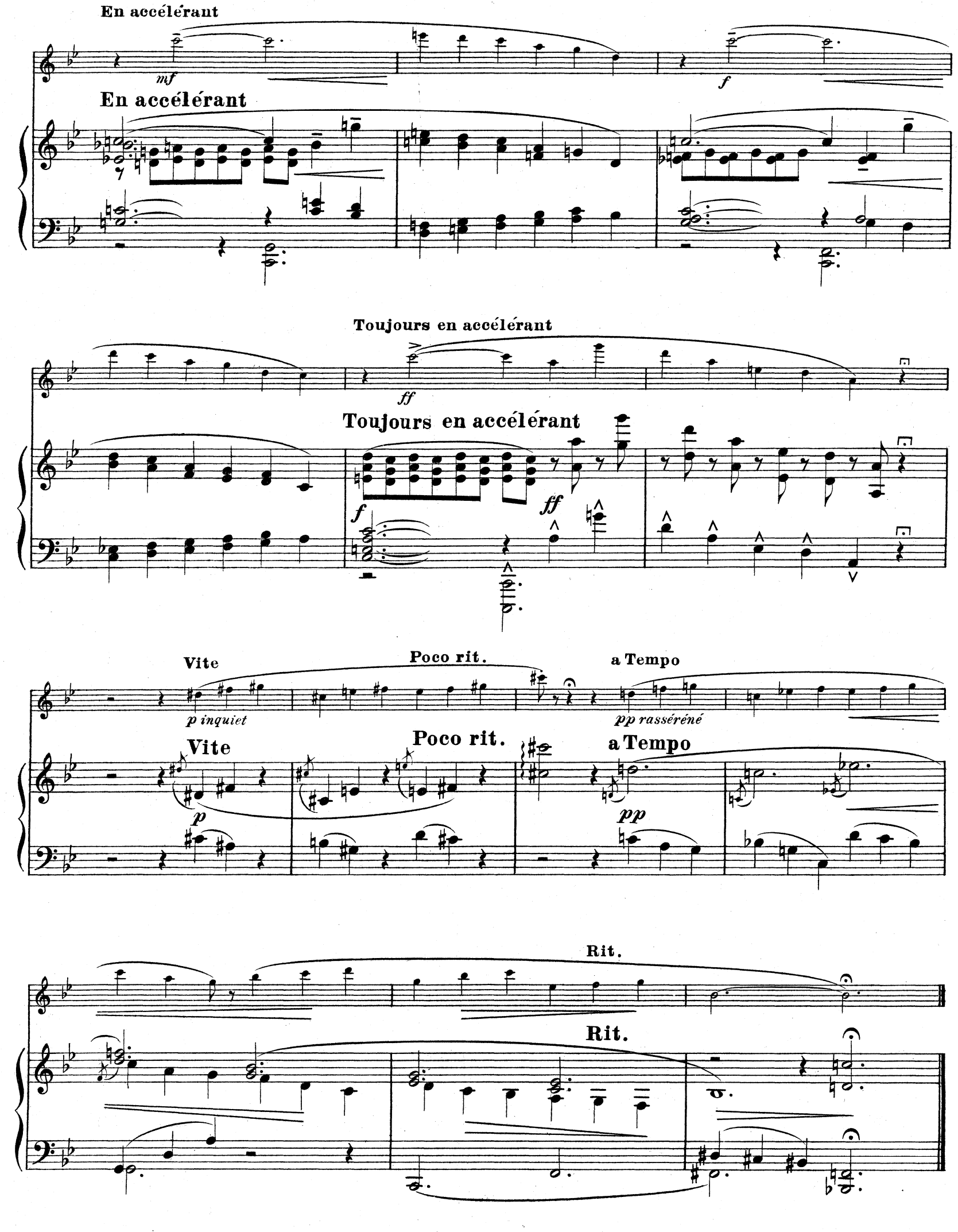
D.& F. 10,851