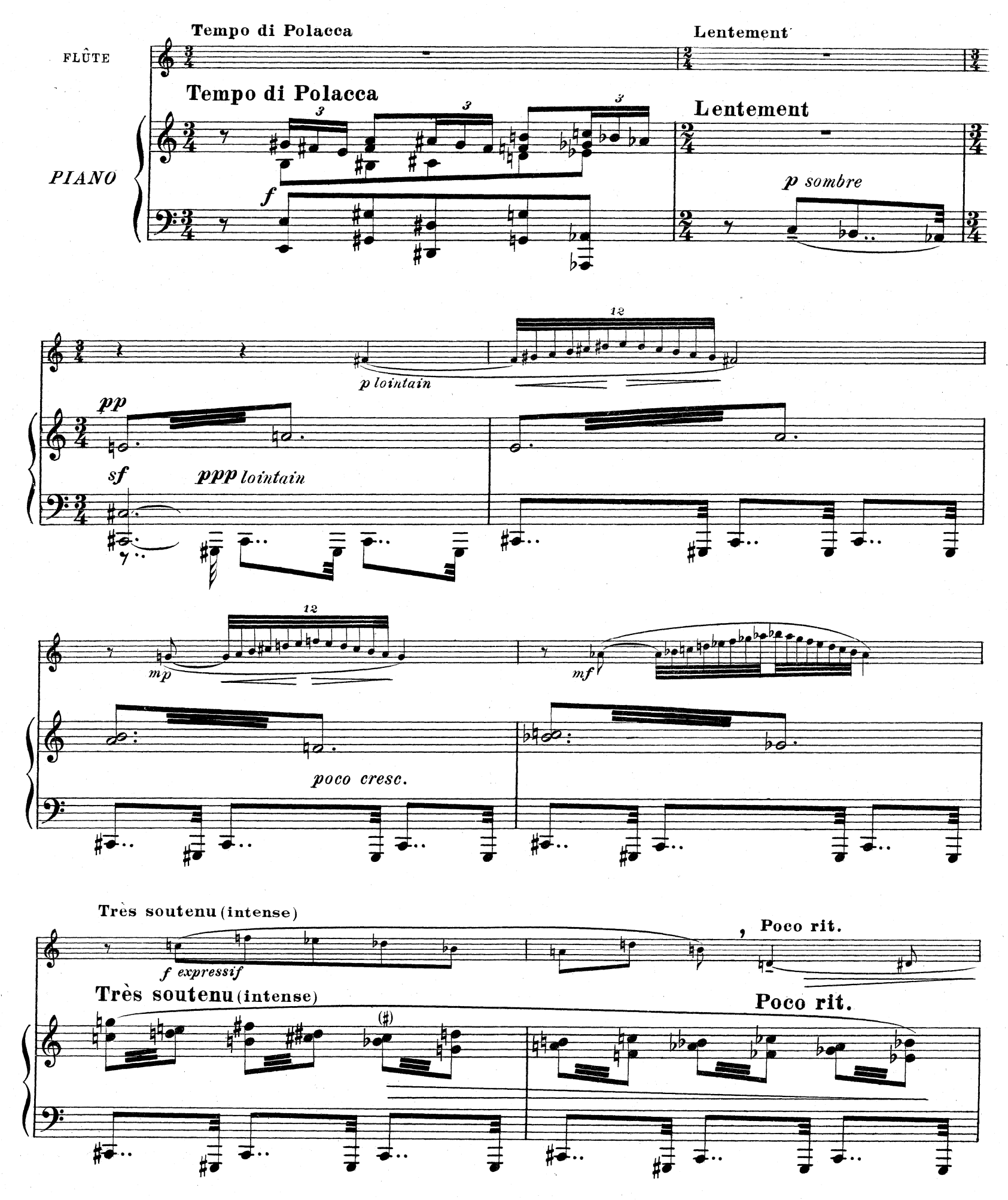
D,& F. 10,851