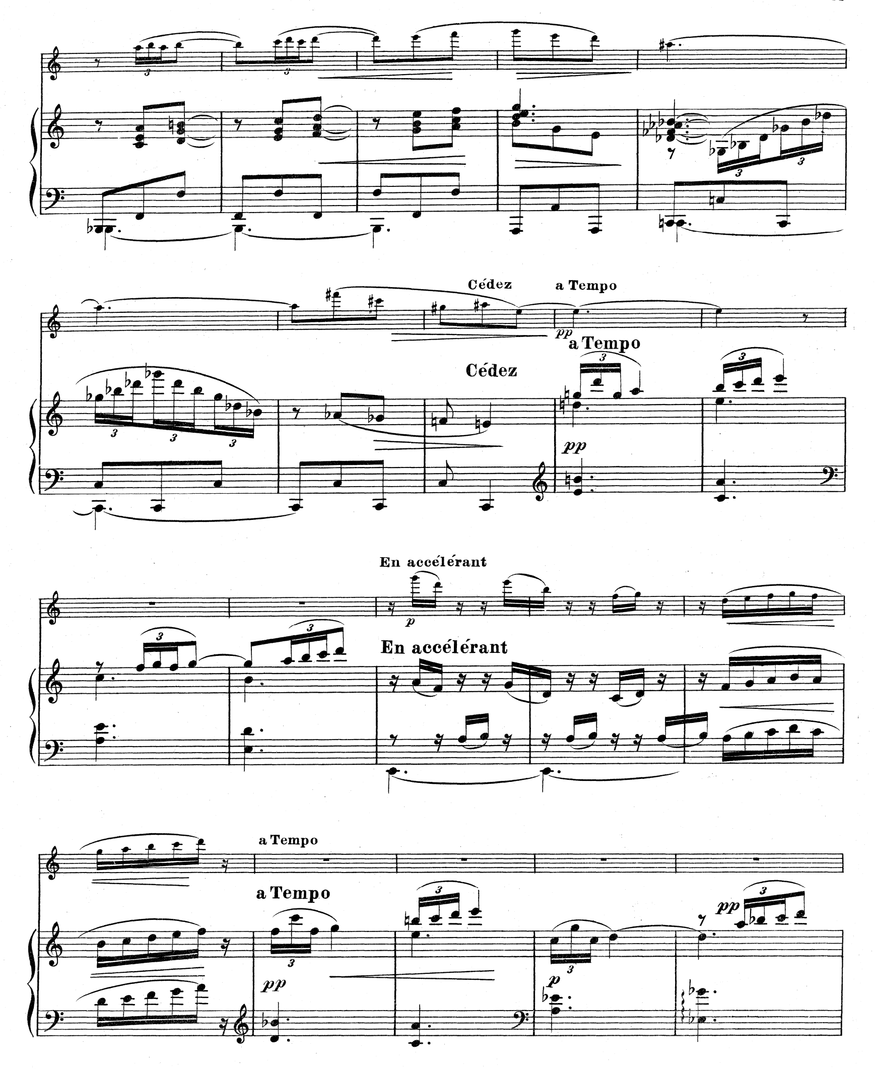
D.& F. 10,851