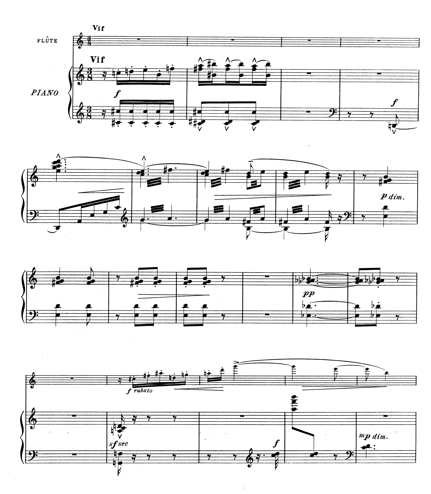
D. & F. 10,851