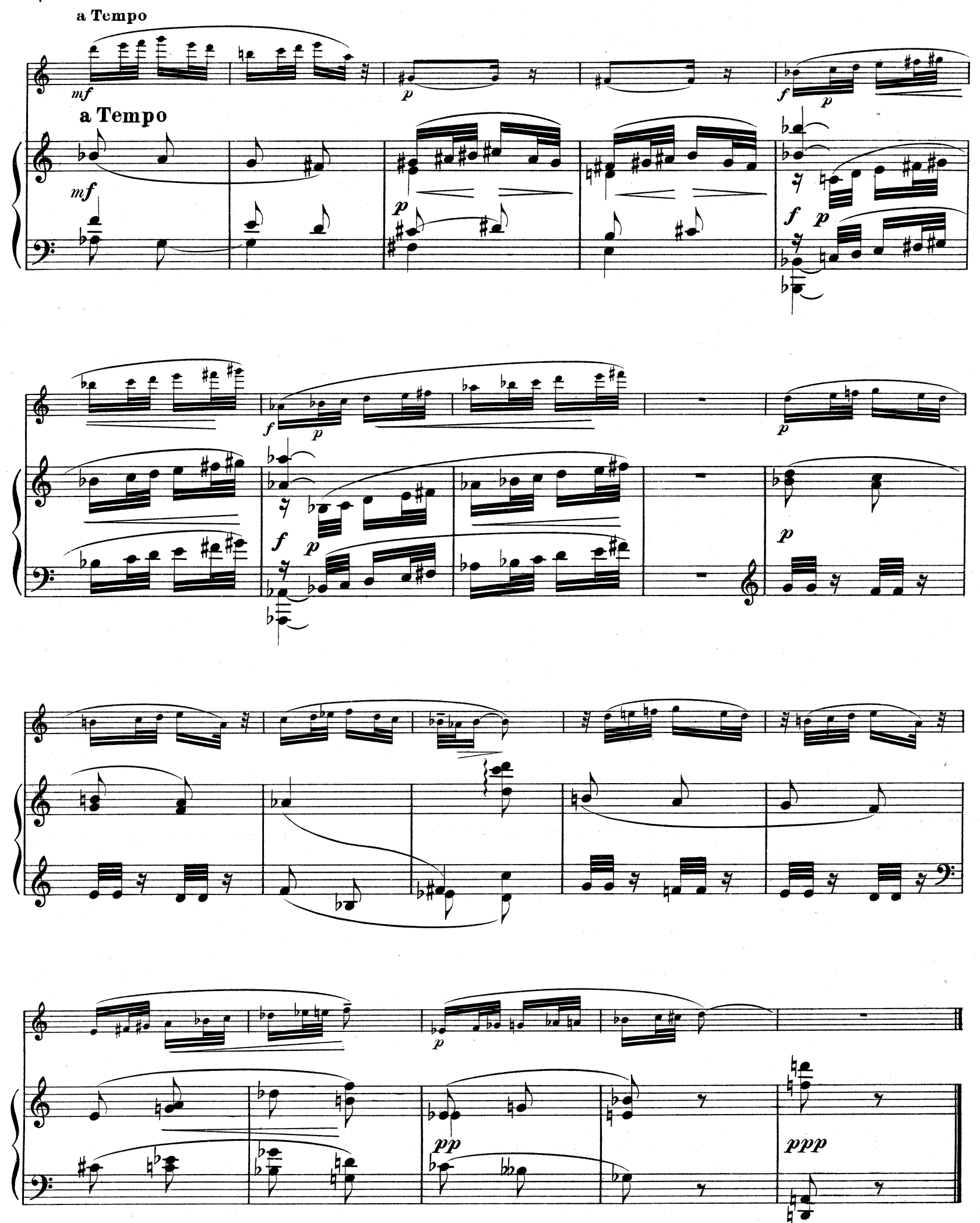
D.& F. 10,851